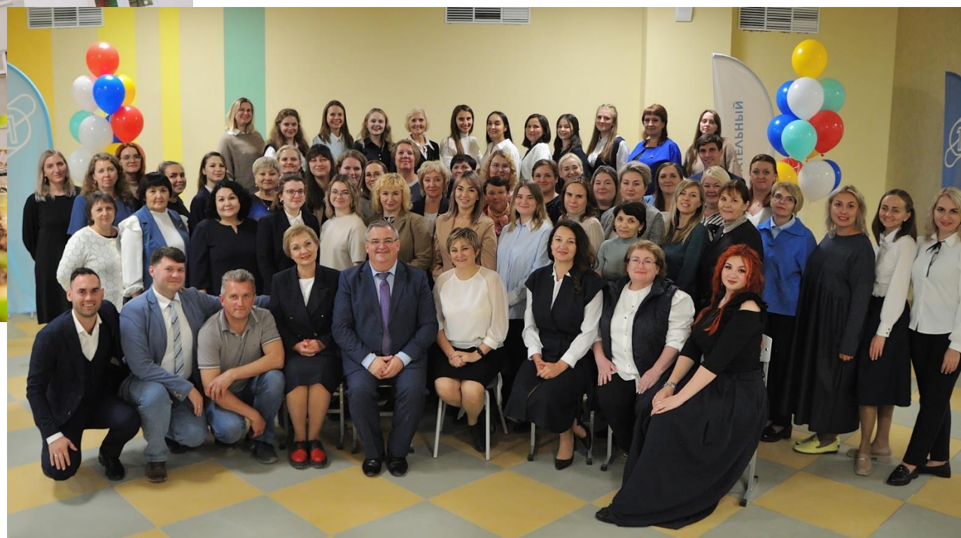
Коллектив МОУ «ОЦ № 1»