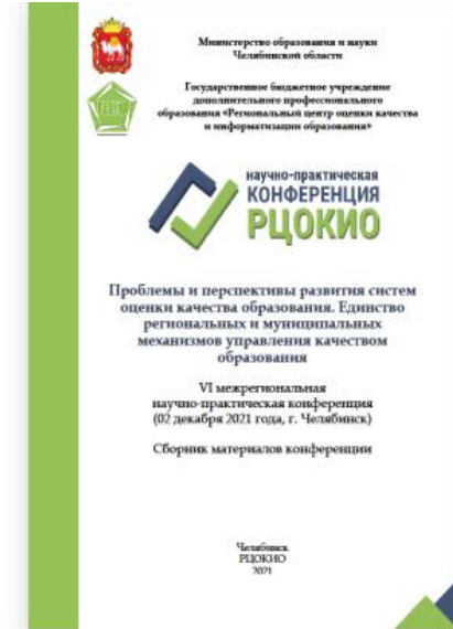
Ежегодная межрегиональная научно-практическая конференция «Проблемы и перспективы развития систем оценки качества образования»