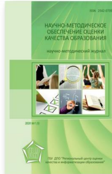
Научно-методический журнал «Научно-методическое обеспечение оценки качества образования»